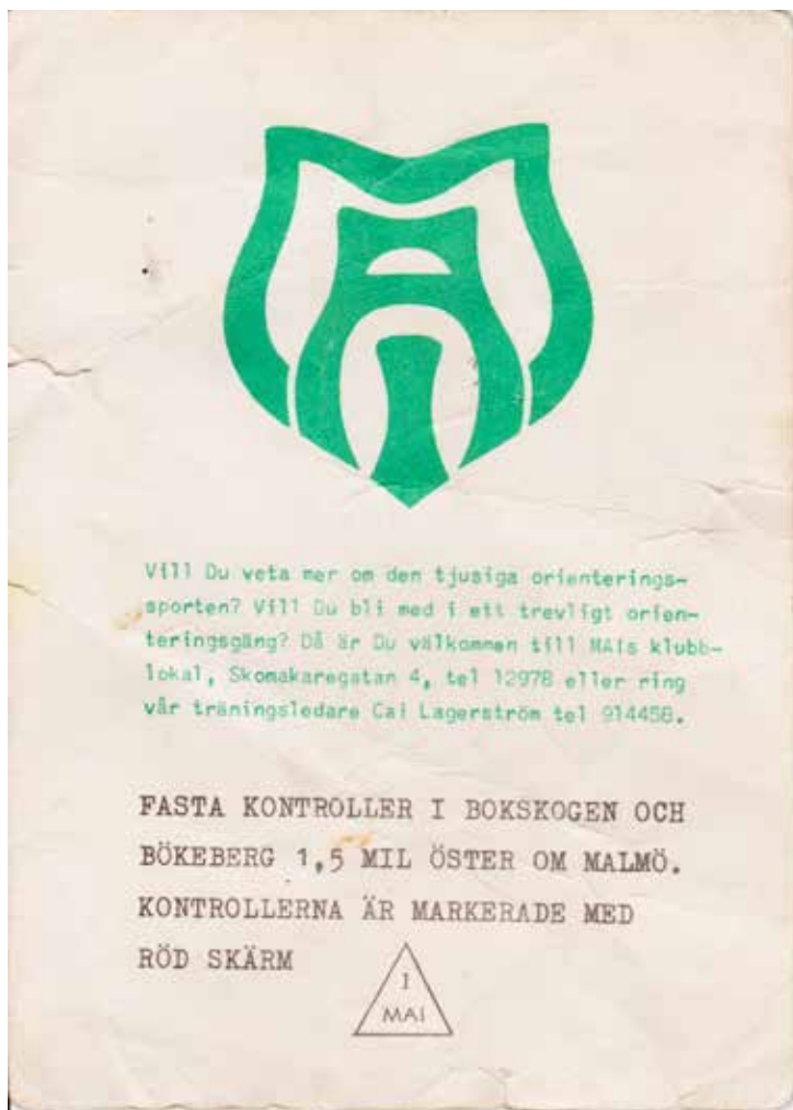
Omslaget till MAIs fasta kontroller