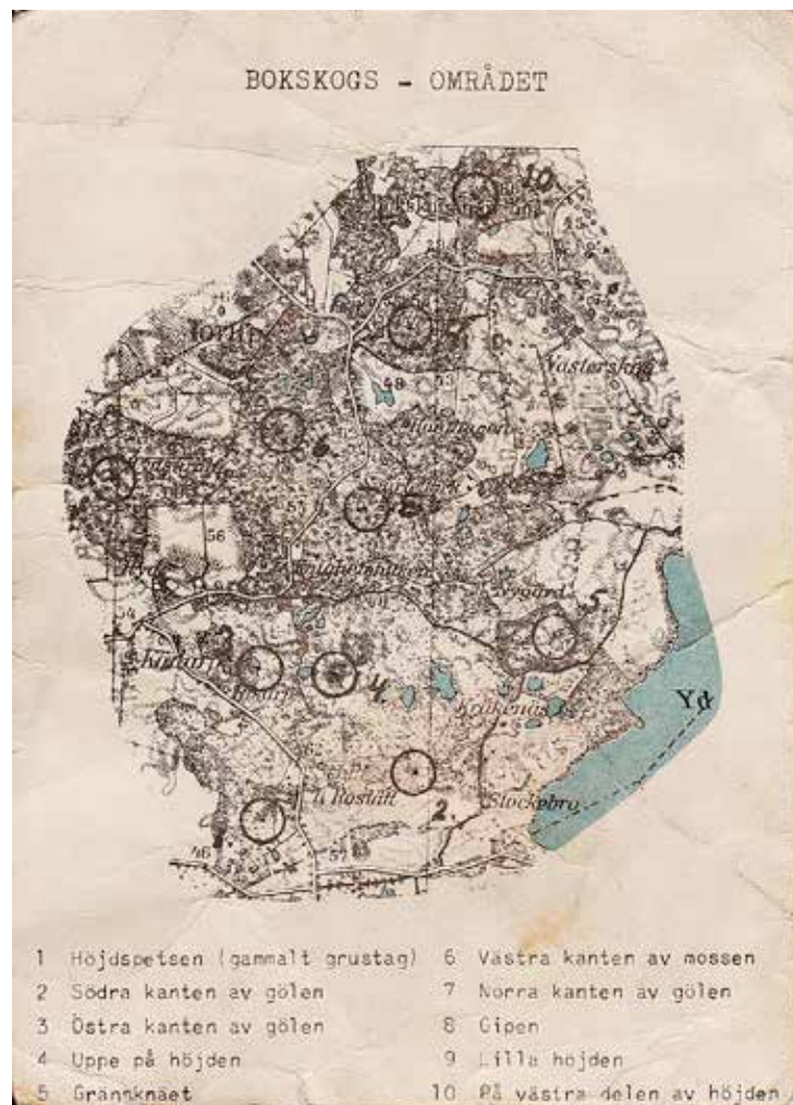
Kartan med fasta kontroller

När det gäller Skofs dataprogram använde vi i början manuell tidtagning, med uträkning av tid och införing av tiden på resultatrem-sor enligt ovan.