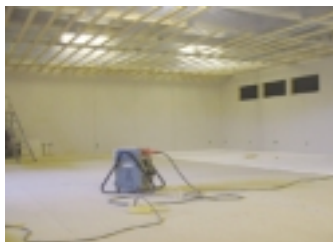
Den 1 mars är golvet nästan klart.

pengar till sektionsskassen. Dessa pengar ansåg MAL:s huvudstyrelse skulle överföras till MAL:s huvudkassa. Detta förslag blev inte populärt bland orienterarna då man ansåg att dessa pengar hade man själv jobbat ihop och skulle utnyttjas till något lämpligt ändamål. Vid ungefär samma tidpunkt d.v.s. vintern - våren 1966 var det allmän diskussion inom klubben och även inom SOFT