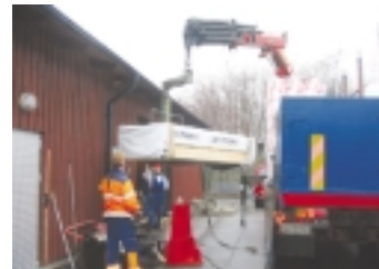
Leverans av trävirke till taket.