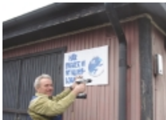
Ombyggnaden kan börja.

I dagsläget vet vi inte vad som skall ske och hur, men en festkommitté är tillsatt och den arbetar nu fram ett invigningsprogram. Närmare detaljer kommer att finnas anslagna på 3 ställen; på klubblokalen (den gamla), på den nya klubbstugan och på vår Websida och sist men inte minst kommer vi att skicka ut en inbjudan.