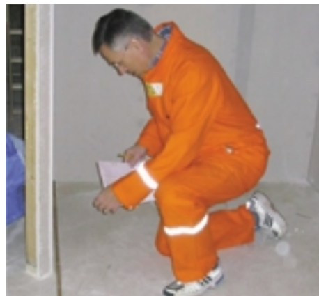
Mats tar mått på kommande matta.