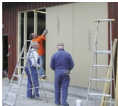
Byggplattor skruvas på reglarna.