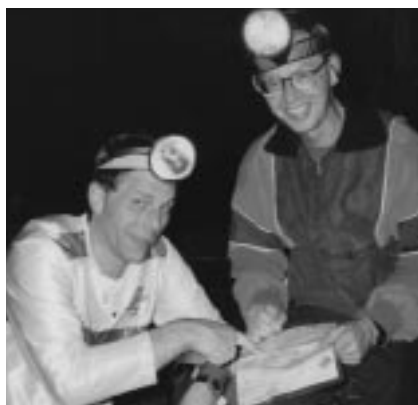
Kartgenomgång efter tävlingen

Krets-mästerskapen var lite mer under kontroll. 70 min på 6 km och 2:a i klassen fick väl vara godkänt för en nybörjare. Det viktigaste var dock vilken upplevelse det var att springa natt. Nu är jag biten och detta var absolut inte sista gången. Nya möjligheter att prova på detta finns det genom att delta i LOK's tisdagsträningar.